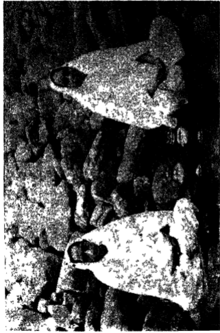
श्रीबाहुबली के पहाड़ पर—पड़ितार्जुन तथा श्रीमती अन्नम्माबायुकी स्तूप पाठ एक रहीं हैं ।